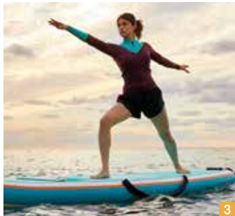
천천히 호흡하며 쉬하는 요가 자세는 체간을 단련시켜 준다