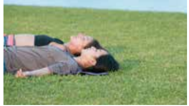
눈부신 햇살 속에서 체험하는 요가는 평온함과 상쾌함이 각별하다