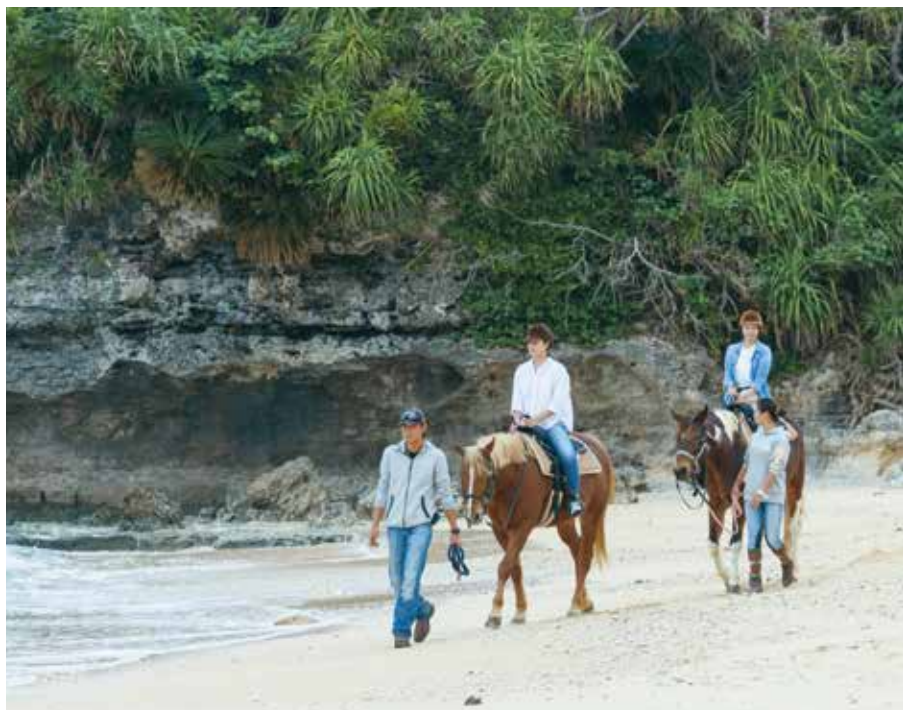
비치 라이딩도 즐길 수 있는 오키나와 승마 클럽