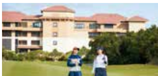
기복이 심한 자연의 지형을 살린 슈레이 컨트리클럽