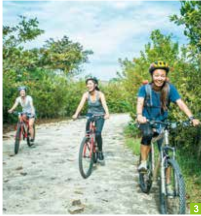
오кина와풍의 도예품을 찾으러 아치문노사토로 고고