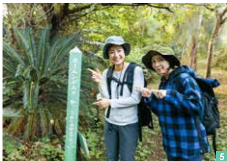
다양한 생물이 서식하는 아열대의 숲을 지나 세계유산의 성터로