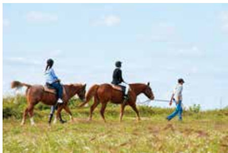
말을 끌어 주므로 초보자도 안심