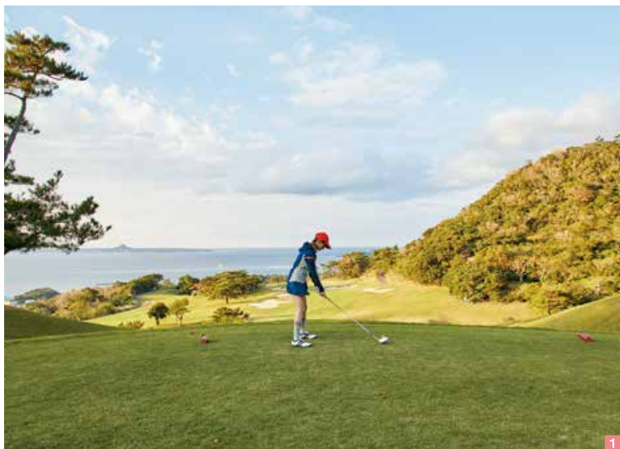
全球場都可眺望大海的 Bel Beach Golf Club