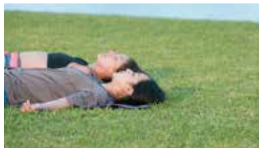
沐浴在太陽光之下的瑜珈感覺特別舒服