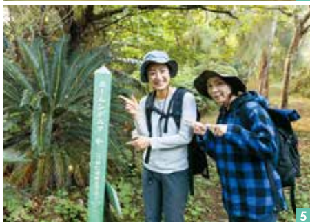
穿過孕育多樣生物的亞熱帶森林，往世界遺產的城跡出發