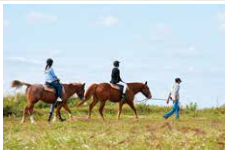
在教練牽引下，初學者也能安心騎馬